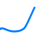
CARTA GEOMORFOLOGICA DI DETTAGLIO - PLANIMETRIA DI PROGETTO CON UBICAZIONE INDAGINI - SCALA 1: 200