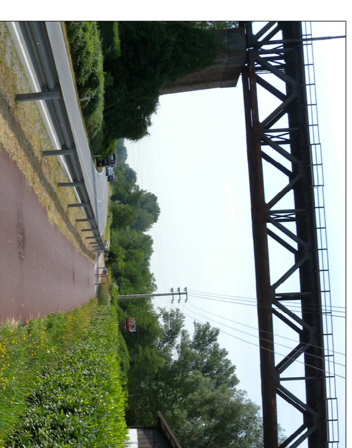
PANORAMICA AREA IN ESAME

GEOPLANET Geologia Applicata, Geotecnica, Idrogeologia, Geologia Ambientale, Pianificazione Territoriale Via Edison 18/a - 23875 Ossago (LC) Via Oleggussa N.8 - 23823 Calcio (LC) tel/fax 0341-931962 tel. cell. 338-2195909 E-Mail: geoplanet@infinito.it studiogeoplanet@libero.it