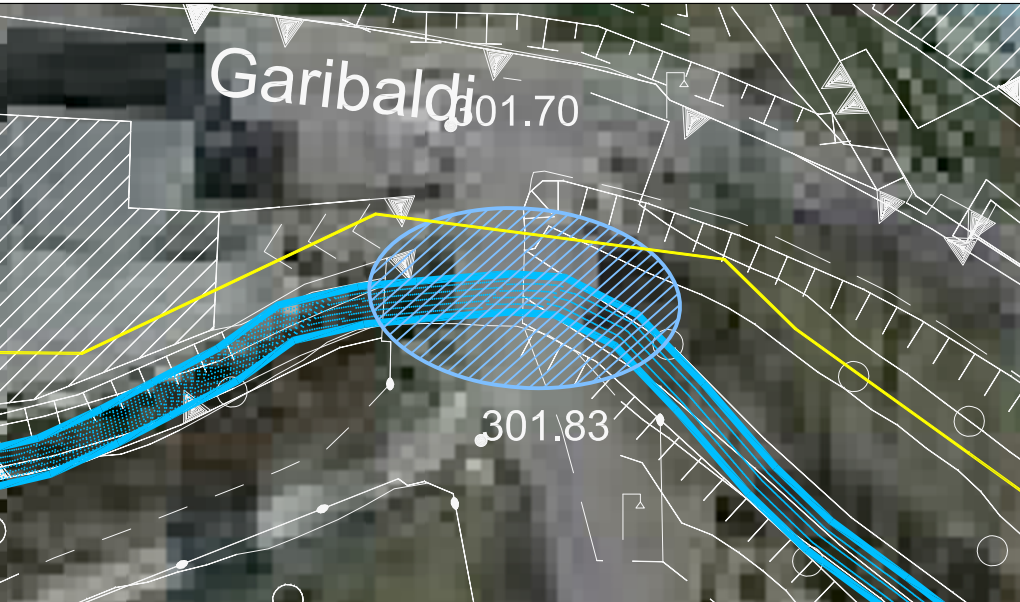
PARTICOLARE INTERVENTO A1