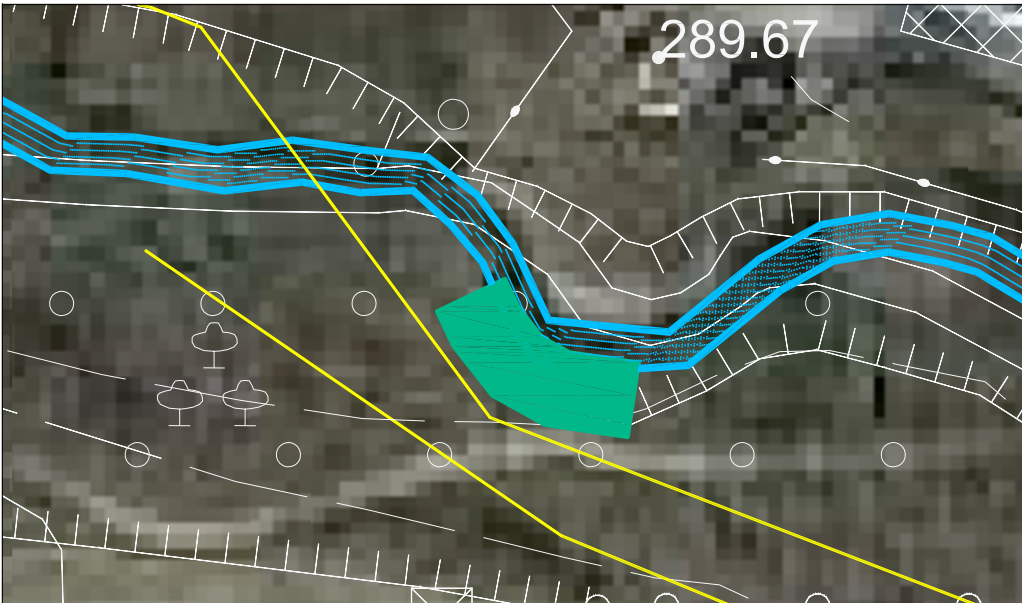
PARTICOLARE INTERVENTO C4