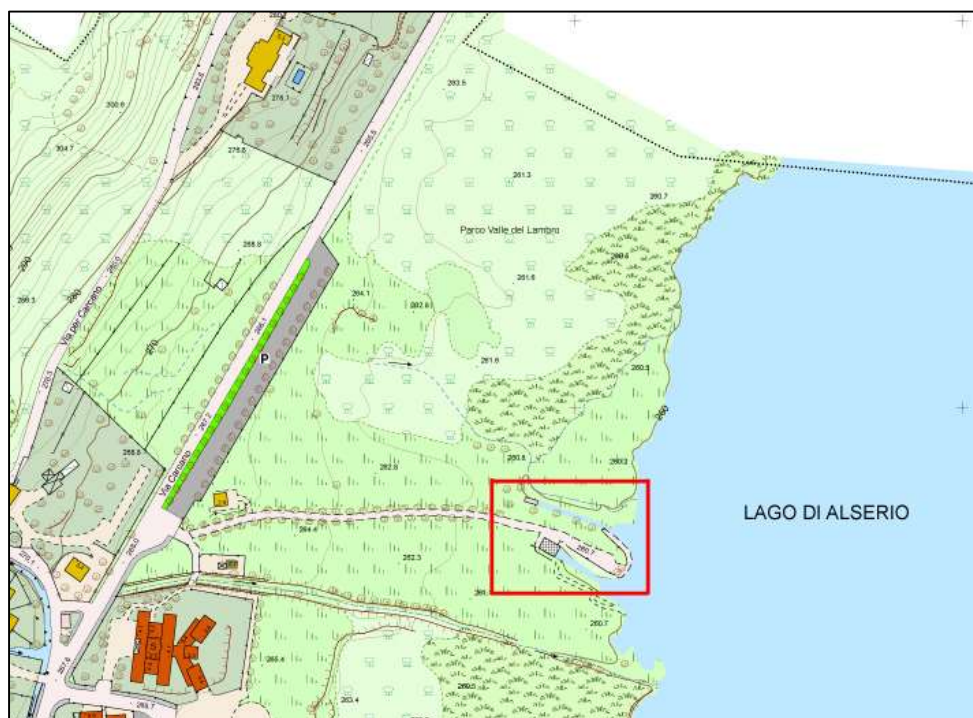
ESTRATTO PGT ALSERIO