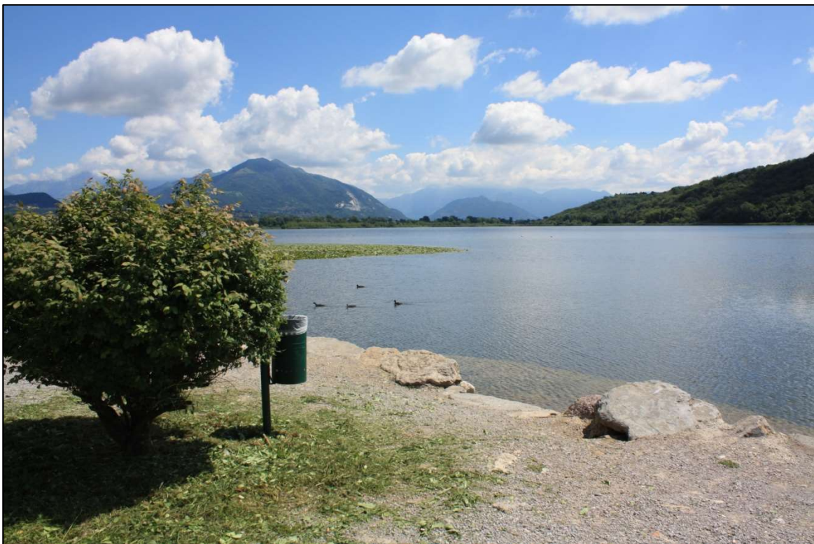
Figura 1 - VISTA LAGO ALSERIO dai GIARDINI A LAGO

Il Piano Territoriale di Coordinamento del Parco Regionale della Valle del Lambro classifica il territorio facente parte del SIC "Lago di Alserio" prevalentemente nel Sistema delle aree fluviali e lacustri (art. 10) e in parte come Sistema delle aree prevalentemente agricole (art.11).